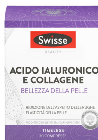
SWISSE BELLEZZA DELLA PELLE 30 compresse