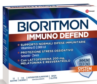
BIORITMON IMMUNO DEFEND 12 bustine