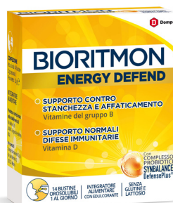
BIORITMON ENERGY DEFEND 14 bustine orosolubili