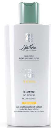
DEFENCE HAIR SHAMPOO NUTRIENTE RIPARATORE 200 ml