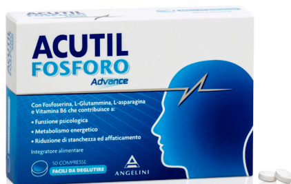
ACUTIL • Fosforo Advance 50 compresse • Fosforo Advance 10 flaconcini • Donna 20 compresse