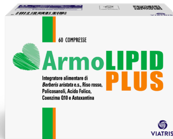
ARMOLIPID PLUS 60 compresse