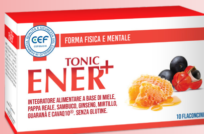
ENER+ TONIC 10 flaconcini