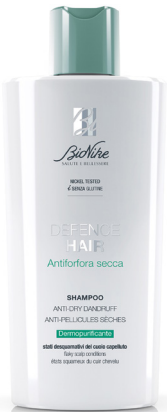
DEFENCE HAIR SHAMPOO ANTIFORFORA SECCA DERMOPURIFICANTE 200 ml