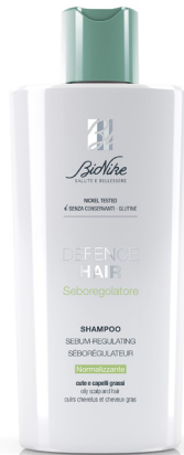
DEFENCE HAIR SHAMPOO SEBORREGOLATORE NORMALIZZANTE 200 ml