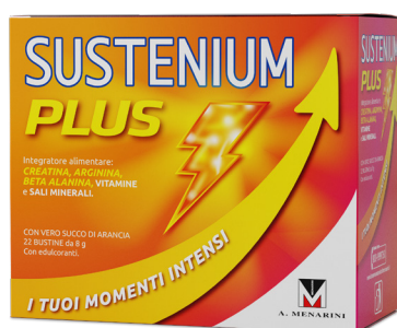
SUSTENIUM PLUS 22 bustine da 8 g