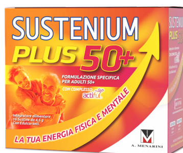
SUSTENIUM PLUS 50+ 16 bustine da 4,5 g