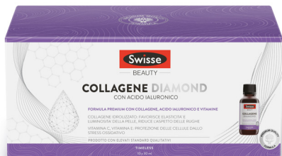
SWISSE COLLAGENE DIAMOND 10 flaconcini 30 ml