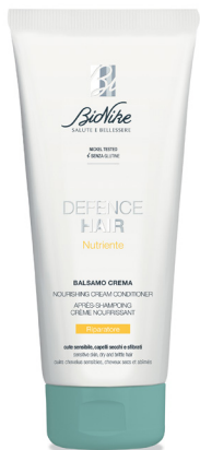
DEFENCE HAIR BALSAMO CREMA NUTRIENTE 200 ml