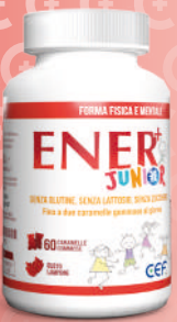
ENER+ JUNIOR NUOVO GUSTO LAMPONE 60 caramelle gommose