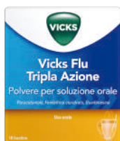
VICKS FLU TRIPLA AZIONE Polvere per soluzione orale 10 bustine