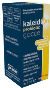
KALEIDON PROBIOTIC GOCCE Flacone da 5 ml