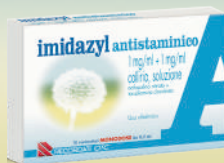
IMIDAZYL ANTISTAMINICO 1 mg/ml + 1 mg/ml COLLIRIO 10 contenitori monodose da 0,5 ml