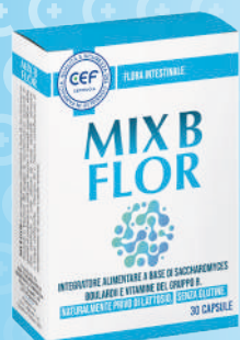
MIX B FLOR 30 capsule