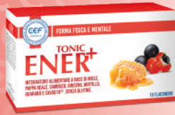
ENER+ TONIC 10 flaconcini