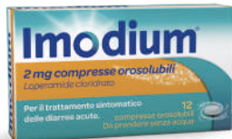
IMIDIUM 2 mg 12 compresse orosolubili