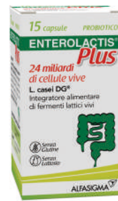
ENTEROLACTIS PLUS 15 capsule