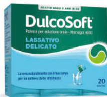
DULCOSOFT • Polvere per soluzione orale Macrogol 4000 20 bustine • Soluzione orale 250 ml