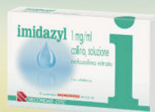
IMIDAZYL 1 mg/ml COLLIRIO 10 contenitori monodose da 0,5 ml