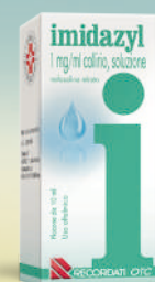
IMIDAZYL 1 mg/ml COLLIRIO Flacone da 10 ml