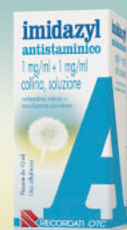
IMIDAZYL ANTISTAMINICO 1 mg/ml + 1 mg/ml COLLIRIO Flacone da 10 ml