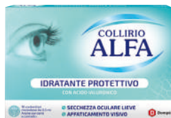
COLLIRIO ALFA IDRATANTE PROTETTIVO 10 contenitori monodose da 0,5 ml