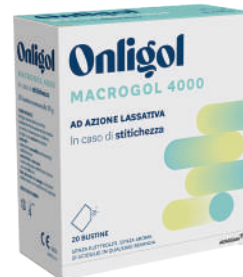
ONLIGOL MACROGL 4000 20 bustine