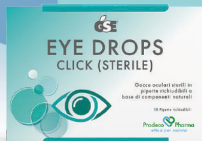
GSE EYE DROPS CLICK (STERILE) 10 pipette richiudibili