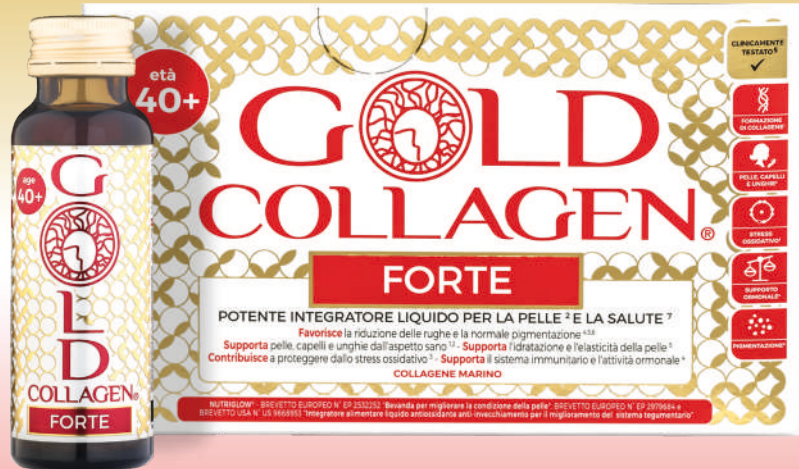
GOLD COLLAGEN FORTE 10 flaconi