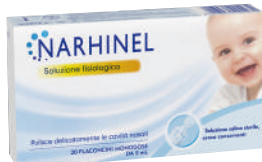
NARHINEL SOLUZIONE FISIOLGICA 20 flaconcini monodose da 5 ml

CONTINUA LA PROMOZIONE DI FEBBRAIO VALIDA FINO AL 31 MARZO 2025