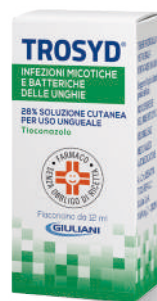
TROSYD 28% SOLUZIONE CUTANEA Flaconcino da 12 ml