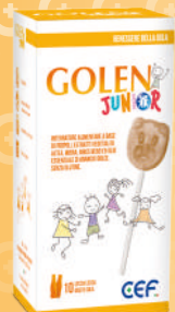
GOLEN JUNIOR LECCA LECCA 10 pezzi